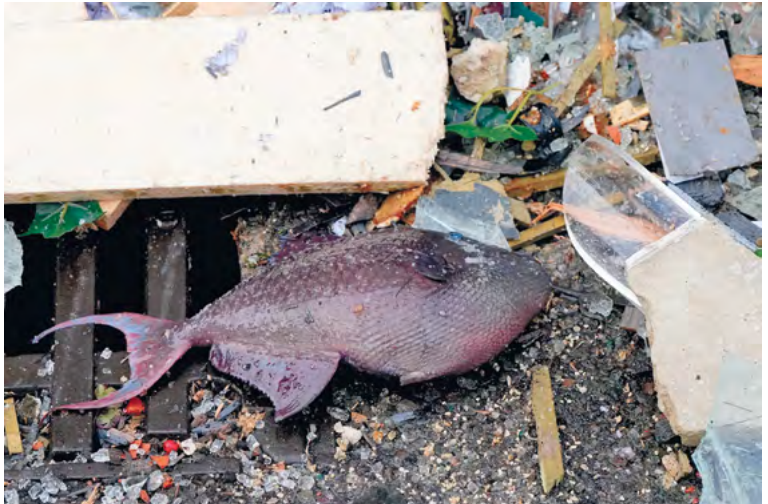
विनष्ट आक्राइडम और मृत मछली।