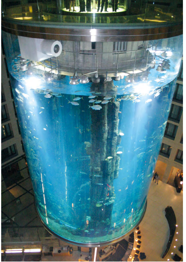
बर्लिन के रेडिसन कलेक्शन होटल में आक्वाडोम।

विगत 16 दिसम्बर 2022 को बर्लिन के रेडिसन कलेक्शन ब्लू होटल में स्थित 50 फिट ऊँचा और 38 फिट चौड़ा विशाल बेलनाकार (सिलिण्ड्रीकल) अक्रेरियम बहुत बड़े विस्फोट के साथ टूटकर ध्वस्त हो गया। विस्फोट का कारण अभी तक पता लग