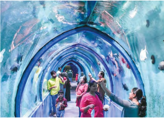
बेंगलुरु के राष्ट्रीय फेमिली फेयर में समुद्री टनल अकेरियम।